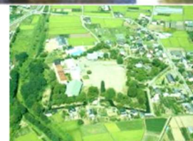
田口城よりの展望